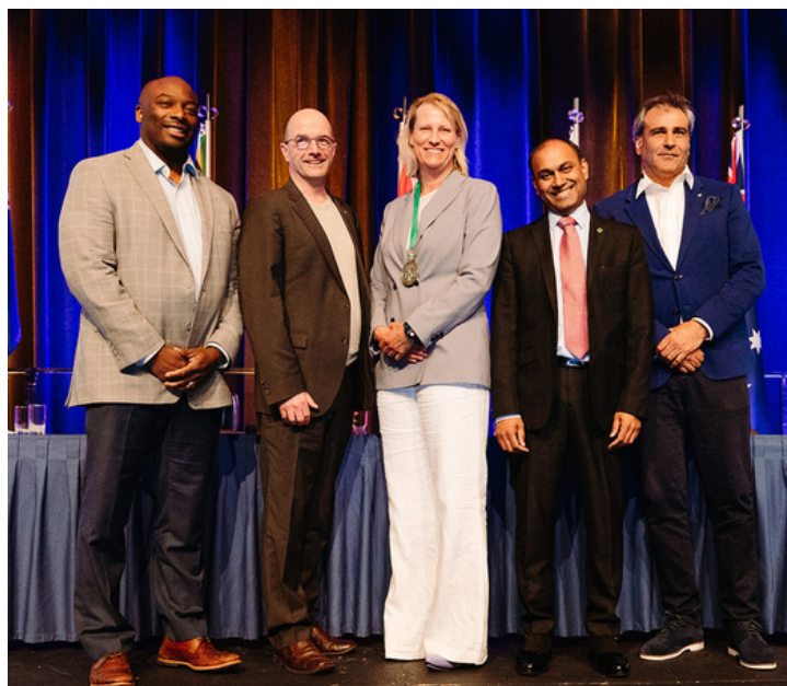
Ligne présidentielle 2022-2023 de l'ACO